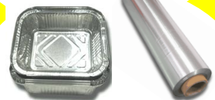
safates i paper d'alumini