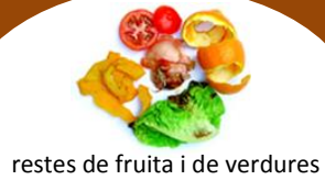
restes de fruita i de verdures