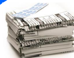
diaris i revistes