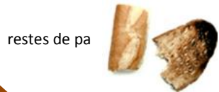
restes de pa