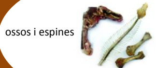
ossos i espines