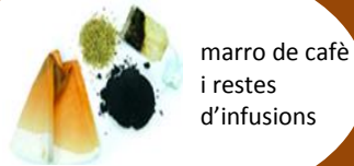
marro de cafè i restes d'infusions