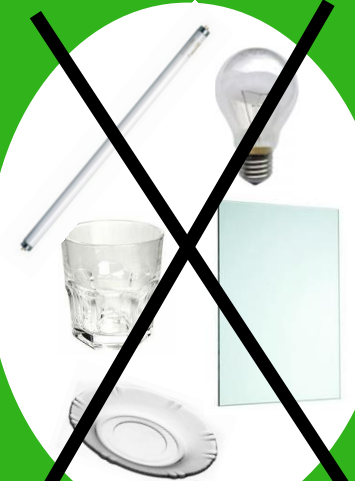
vidre pla (finestres, miralls, plats, gots, etc.), bombetes i fluorescents