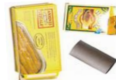
envasos de paper/cartró