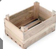
caixes de fusta