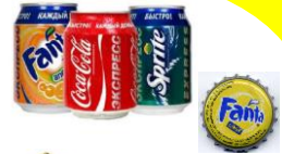
llaunes i xapes