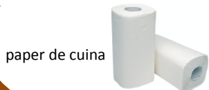
paper de cuina