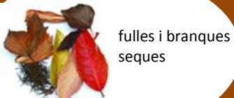
fulles i branques seques