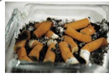
burilles i cendres