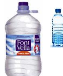
ampolles i garrafes xafades