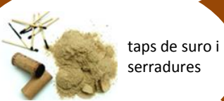
taps de suro i serradures